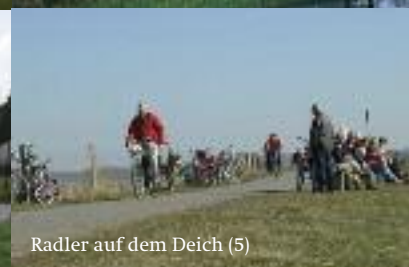
Radler auf dem Deich (5)