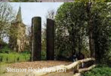
Steintor Hoch-Elten (25)