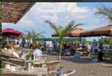
Promenade Tolkamer (6)