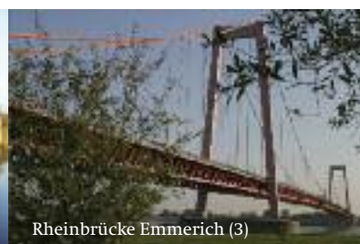
Rheinbrücke Emmerich (3)