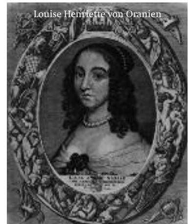
Louise Henriette von Oranien

Entlang eines alten Rheinarms radeln Sie wieder in Richtung Kleve (5). Am Deich wartet unter anderem das Café im Gärtchen im Klever Ortsteil Keeken mit leckeren Speisen und Getränken auf Ihren Besuch. Nachdem Sie Düffelward passiert haben, gelangen Sie wieder zurück zum Startpunkt (26).