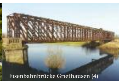
Eisenbahnbrücke Griethausen (4)